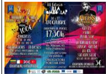
Παράδειγμα αφίσας μίας παρόμοιας εκδήλωσης που διοργανώθηκε από το “Via Urbana”